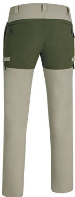
Vista parte trasera de la prenda